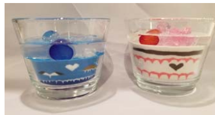
グラスの中に色砂を入れて模様をつくります（1個）