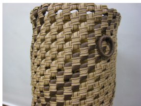
②クラフトバンド教室(作品例)