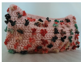
⑥編み物教室(作品例)